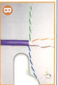
T568A: green and brown pair up T568B: orange and brown pair up