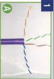
Align pairs as shown